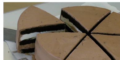
生チョコムースホールケーキ