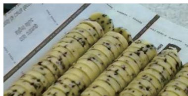
アイスボックスクッキー