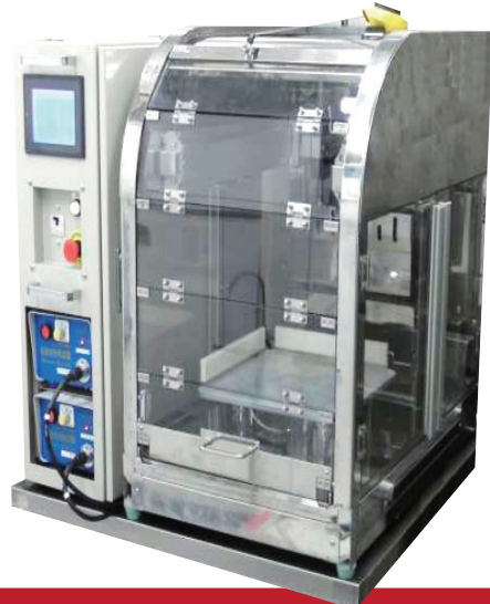
分割型 320幅マルチスライサー

320角シートケーキ (6取り天板2分割) 350長さ ロール/パウンドケーキ 9号ホールケーキ