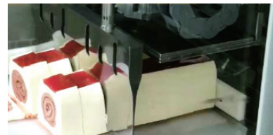
冷凍ロールケーキ (-16℃)