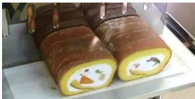
フルーツ入りロールケーキ (常温)

320角シートケーキ (6取り天板2分割) 350長さ ロール/パウンドケーキ 9号ホールケーキ